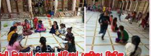
ਪ.ਪ੍ਰ.ਭ.ਸੀ. ਆਈ.ਆਈ.ਸੀ. ਟਕਸ਼ ਪ੍ਰ. ਸ਼੍ਰੀ ਰਾਮੀ ਨਿਸ਼ਾਮਿ ਠਾਕੁਰ ਮੰਦਿਰੀ ਠਾਕਿਰੀ ਠਾਕਿਰੀ