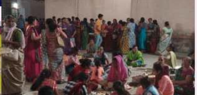
ਠਾਕੁਰੀ ਠਾਕੁਰੀ ਮਠੀਠਾਕੁਰ ਮਸੰਗੇ ਠਾਕੁਰੀ ਗੁਰੂਗੁਰੂ ਮੰਦਿਰੀ ਠਾਕੁਰੀ